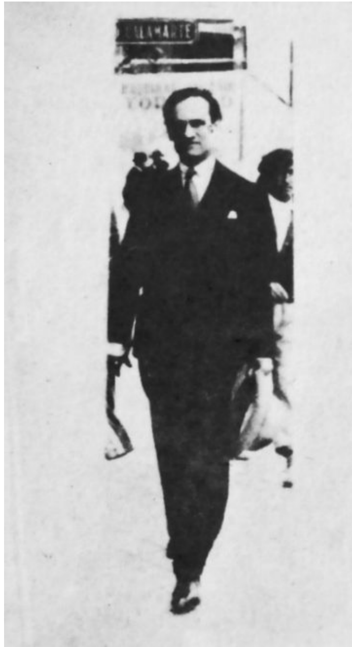
César Vallejo en una calle parisina.