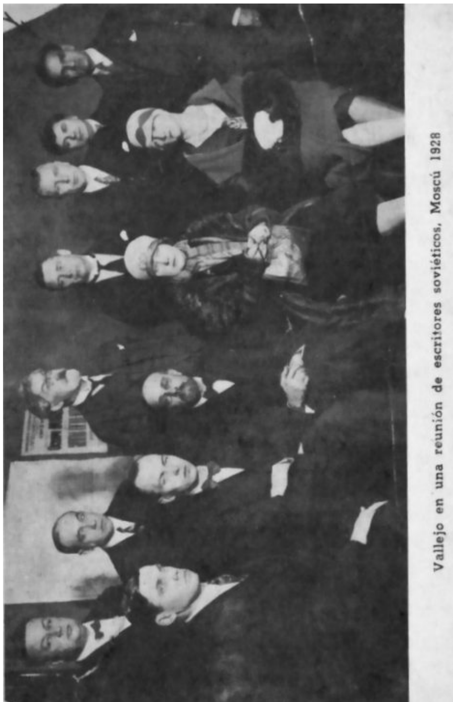
Vallejo en una reunión de escritores soviéticos, Moscú 1928