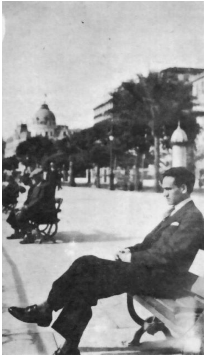
César Vallejo en París, 1924.